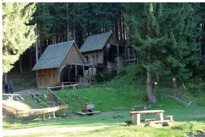
CERTIFIKÁT PRO ZÁŽITEK. Značku jeseníckého zvonku ponese také Zlatorudné mlýny.

stát, že některý výrobek či služba nemusí získat značku. Daný subjekt pak dostane od komise doporučení, jak na certifikát dosáhnout,“ uvedla