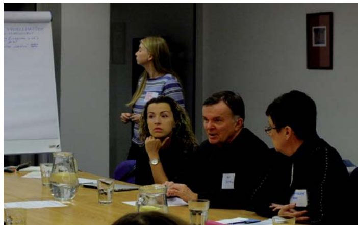
KULATÝ STŮL. Odborníci a příbuzní nemocných udělali první krok k budoucí spolupráci.

Z diskuse vyplynulo, že nabídka zdravotní, psychosociální a duchovní pomoci v Olomouckém kraji je sice funkční, ale je nerovnoměrně geograficky rozmístěná a liší se i kvalitou poskytovaných služeb. Navíc jsou zejména psychosociální služby stále poměrně málo využívané, pravděpodobně také z důvodu omezování onkologického onemocnění pouze na oblast léčby. „Příčinou je především nízká