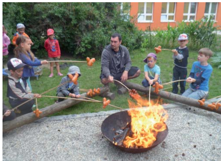
TEST PRO DOSPĚLÉ A JEJICH DĚTI. Jak ukázal projekt Montessori Olomouc, spokojení rodiče měli větší zájem trávit s dětmi volný čas. Do mimoškolních aktivit se s chutí zapojili i tatínci.

ňoval rodičům dostat se do práce na 7 hodin, odjet na pracovní cestu a podobně. Rodiče tuto příležitost