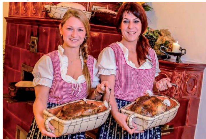
SVATOMARTINSKÉ HODY. V jeseníckých restauracích právě vrcholí gastronomický rok.